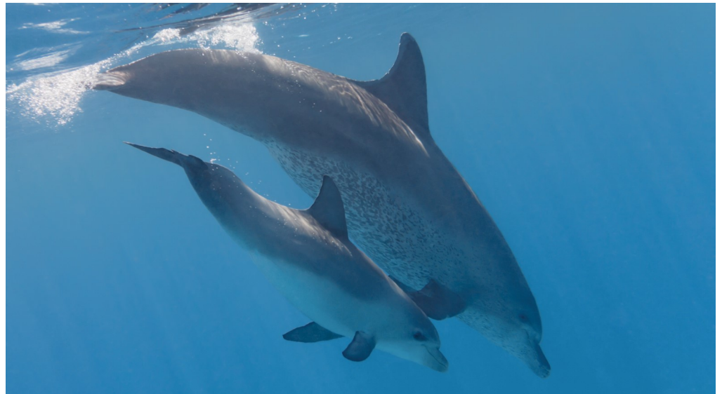
Une femelle dauphin avec son petit

Les dauphins n'utilisent qu'un seul côté de leur cerveau pour dormir à la fois. Pendant qu'une moitié dort, l'autre moitié reste en éveil pour éviter la noyade.